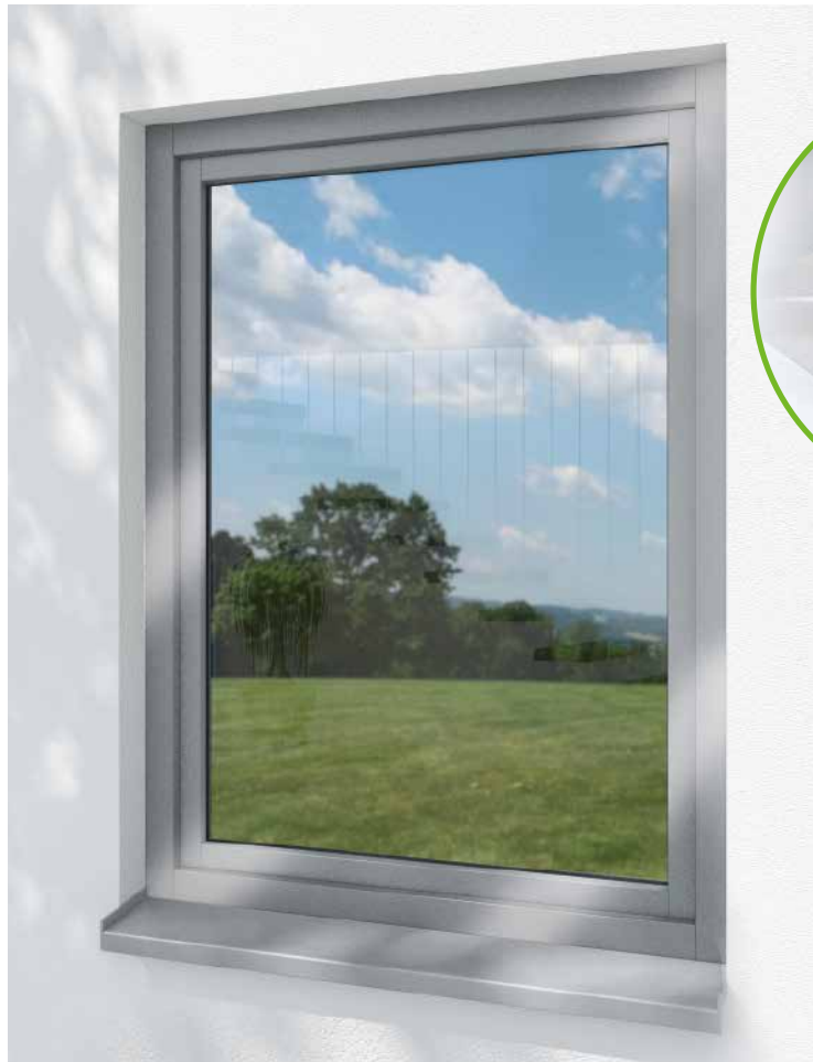
Schüco TopAlu Classic für alle Systeme