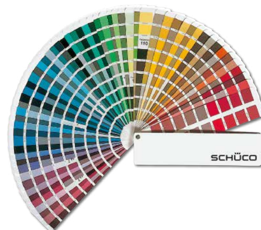
RAL- und Eloxal-Farben

Selbst im Detail bieten Ihnen die Aluminium-Deckschalen der Schüco TopAlu Serie noch individuellen Gestaltungsspielraum. So können Sie bei der Ausführung der Element-Ecken zwischen zwei Varianten wählen: die Aluminium-Deckschalen können klassisch auf Gehrung, oder um eine perfekte Aluminium-Fensteroptik zu erzielen, stumpf gestoßen werden.